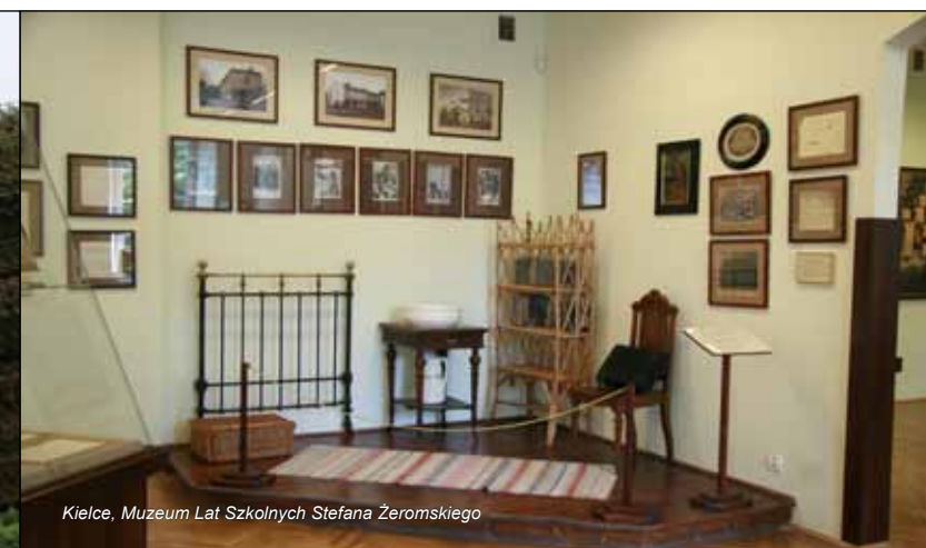
Kielce, Muzeum Lat Szkolnych Stefana Żeromskiego