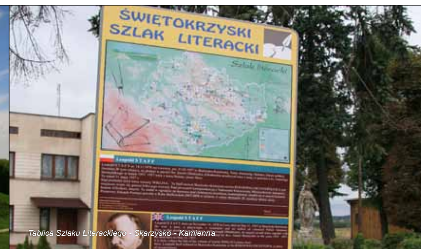
Tablica Szlaku Literackiego - Skarżysko - Kamienna