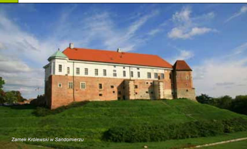
Zamek Królewski w Sandomierzu