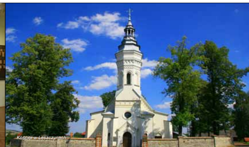
Kościół w Leszczynach