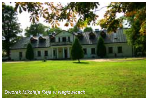
Dworek Mikołaja Reja w Nagłowicach

Nagłowice powszechnie kojarzone są z osobą Mikołaja Reja, który od 1545 roku był tu dziedzicem wzorowo gospodarującym posiadłością. Między innymi zakładał pasieki i zalesiał okolice. Obecnie w zbudowanym w miejscu rejowskiego dworku z 1800 r. znajduje się izba pamięci słynnego autora słów: „A niechaj to narodowie wždy postronni znają, iż Polacy nie gęsi, iż swój język mają”. Prezentuje ona życie i dorobek pisarski Reja oraz obrazuje związki pisarza z Nagłowicami. W zabytkowym parku angielskim otaczającym dworek zachowały się sędziwe dęby pamiętające czasy pisarza. W Dworku Mikołaja Reja działa punkt informacji turystycznej oraz istnieje możliwość skorzystania z noclegów w pokojach gościnnych.