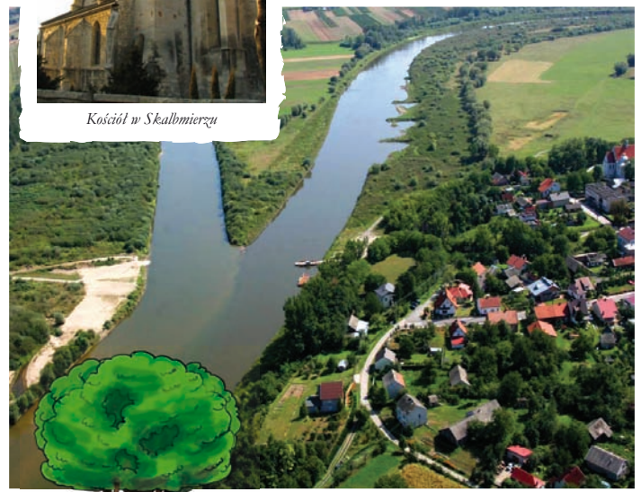
Ujście Dnaja do Wisły