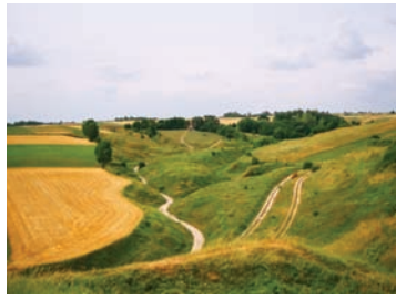
Grodzisko w Stradowie

Grodzisko w Stradowie - wraz z podgrodziami liczy sobie ok. 45 ha