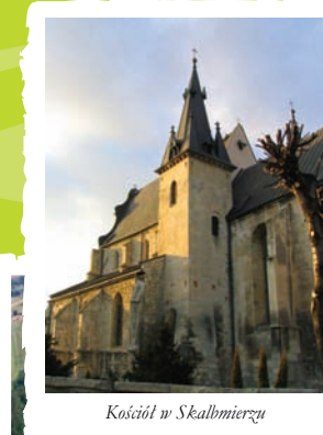
Kościół w Skalbmierzu