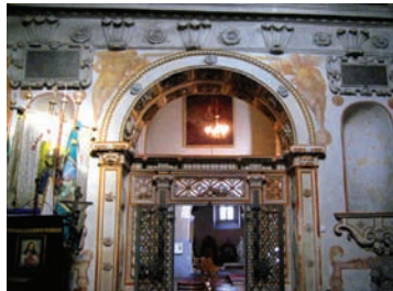
Wnętrze kościoła w Bejsce

Kościół p.w. św. Jakuba - został wzniesiony w stylu gotyckim. Uwagę zwraca bogate wyposażenie wnętrza: belka tęczowa z barokowym krucyfiksem z XVII wieku, stalle z 1. poł. XVII w., barokowy chór muzyczny z prospektem organowym z XVII wieku oraz barokowy obraz patrona świątyni św. Jakuba, znajdujący się w XIX-wiecznym ołtarzu głównym.