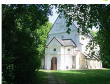
Kościół w Maloszowie

Zbiornik retencyjno-rekreacyjny „Skalbmierz” i kompleks sportowy przy stadionie - powstał w 2005 roku na tarasie rzeczonym w widłach Nidzicy i Szarbiówki. W centralnej części zbiornika znajduje się wyspa, od północy plaża z drewnianym molo, a dookoła biegnie deptak spacerowy. W sezonie letnim czynne są wypożyczalnie sprzętu pływającego: łodzi, kajaków i rowerów wodnych. Przy zbiorniku jest duży parking oraz restauracja i pole bawokowe. Ze zbiornika do kompleksu sportowego prowadzi ścieżka pieszo-rowerowa (ok. 600 m). Znajduje się tam pełnowymiarowe boisko sportowe z oświetleniem, nowoczesny kort tenisowy o sztucznej nawierzchni i sztucznym oświetleniu, plac zabaw dla dzieci oraz miejsce do grillowania.