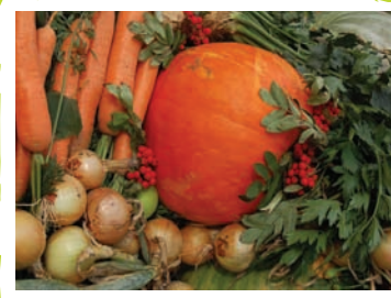
Marchewkowe Święto w Sielcu Kolonii

Skalbmierskie Babie lato – impreza promująca skalbmierskie obyczaje i tradycje, główną atrakcją są suto zastawione stoły z potrawami przygotowanymi przez prężnie działające kółka gospodyń wiejskich. Imprezę