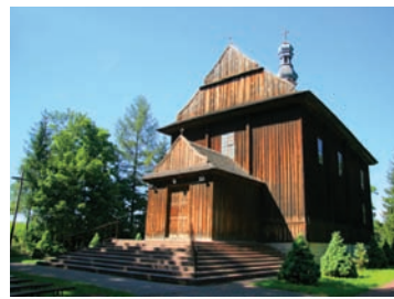
Kościół w Topoli

Kościół parafialny pw. Wniebowzięcia NMP wraz z dzwonnica - kościół modrzewiowy, konstrukcji zrębowej, trójnawowy; wzniesiony w latach 1839 -1840, przeniesiony z Kazimierzy Małej w 1972 roku. Obiekt zrekonstruowany został w 1973 roku i odtworzony w pierwotnej formie. Wnętrze niemalowane; zachowały się tu dwa drewniane ołtarze barokowe (przeniesione z Kazimierzy Małej). W głównym - obraz Wniebowzięcia NMP i Trójca Święta; po bokach natomiast rzeźby śś. Piotra i Pawła.