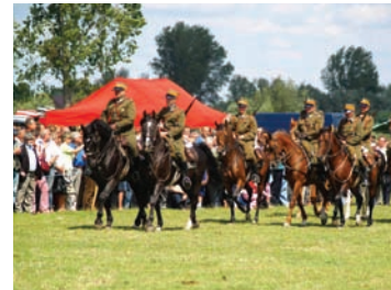
Championat koni małopolskich w Opatowcu