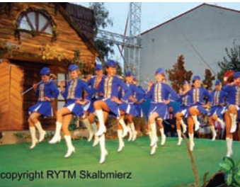
Zespół mażoretkowy „Rytm”

Wycieczka samochodowa połączona ze spacerami na trasie: Czarnocin, Stradów, Topola, Skalbmierz.