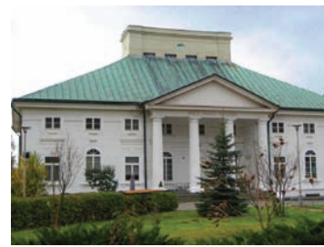
Pałac Badenich w Bejsce

i jest największym tego typu obiektem w Polsce. Jak twierdzą niektórzy historycy, Stradów mógł być stolicą państwa Wiślan. Niestety, nie ma wielu wzmianek o Stradowie i jego władcach. Stradów miał prawdopodobnie większe znaczenie niż Wiślica, ponieważ był on znacznie większy, poza tym Wiślica znajdowała się na krańcach państwa i jej nazwa mogła tylko podkreślać panowanie Wiślan.