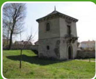
Baszta ogrodowa w Pińczowie