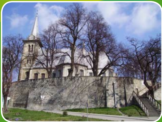
Kościół pw. Świętej Trójcy w Działoszycach