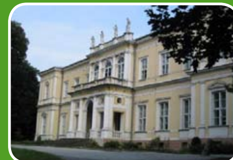
Pałac Wielopolskich w Chrobrzu

Czas nie poskąpił Dolinie Nidy bajecznych pałaców. W Chrobrzu, Sancygnowie i Pińczowie odnajdziesz trzy znakomicie prezentujące się obiekty tego rodzaju.