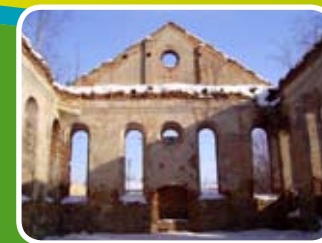
Ruiny Synagogi w Działoszycach