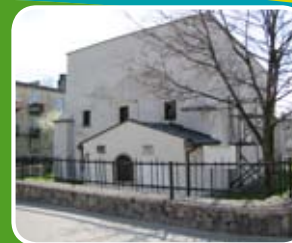
Synagoga w Pińczowie