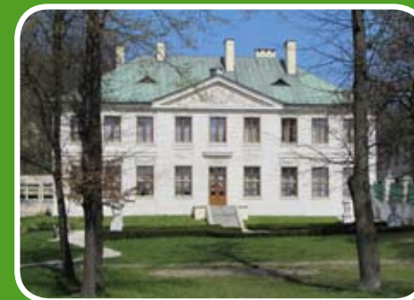
Pałac Wielopolskich w Pińczowie