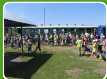
Postój Ciuchci Express Ponidzie w Umianowicach

Chcąc oddać się galopadzie skorzystaj z możliwości jakie stwarza położony na obrzeżach Pińczowa, tuż przy rzece Nidzie, Ludowy Klub Jeździecki „Ponidzie”. Tam już tylko umiejętności jeździeckie będą przeszkodą.