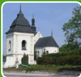
Kościół pw. św. Piotra i Pawła w Kijach