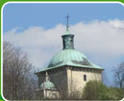
Symbol Pińczowa – Kaplica św. Anny